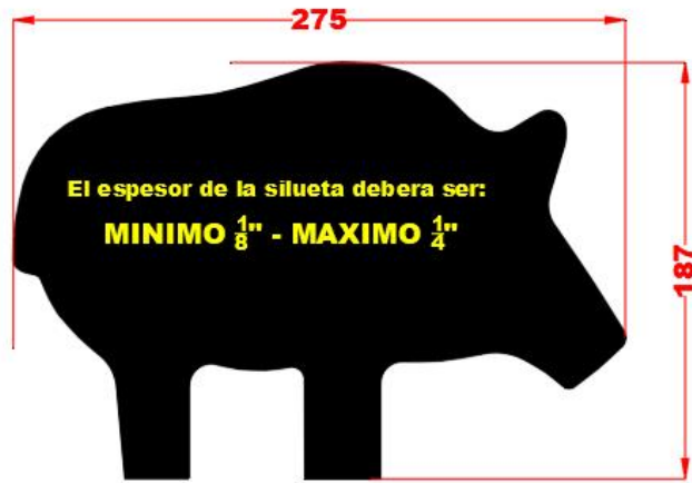
50 - Jabalí

Cualquier club afiliado a FEMETI, podrá descargar estas medidas, las cuales estan en formatos .jpg, .pdf y .dxf (este tipo de archivo lo lee cualquier maquina de corte).