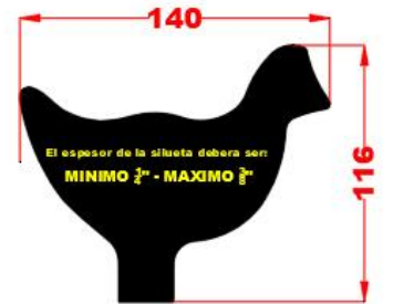
25 - Gallo