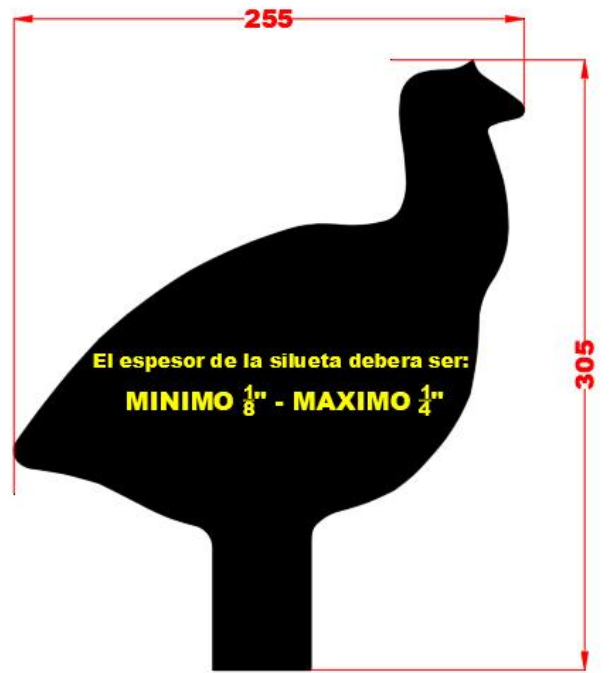
75 - Guajolote

Cualquier club afiliado a FEMETI, podrá descargar estas medidas, las cuales estan en formatos .jpg, .pdf y .dxf (este tipo de archivo lo lee cualquier maquina de corte).