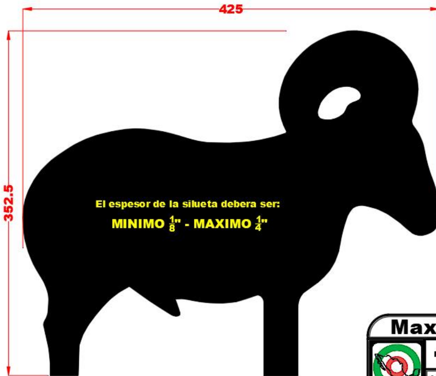
100 - Borrego