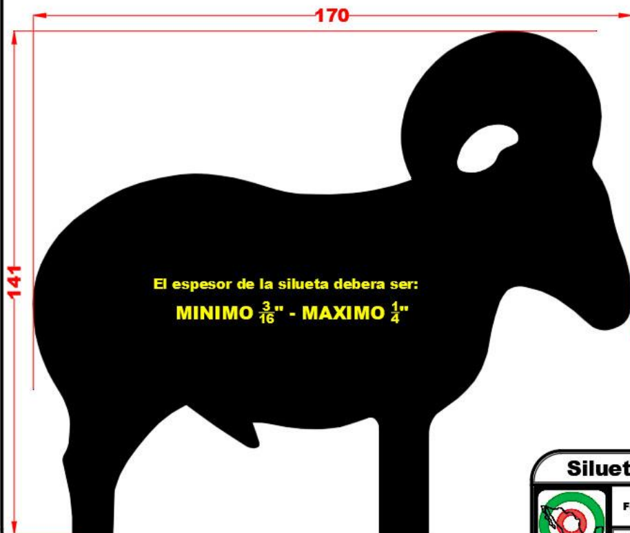
100 - Borrego

Cualquier club afiliado a FEMETI, podrá descargar estas medidas, las cuales estan en formatos .jpg, .pdf y .dxf (este tipo de archivo lo lee cualquier maquina de corte).