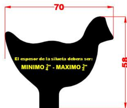
40 - Gallo