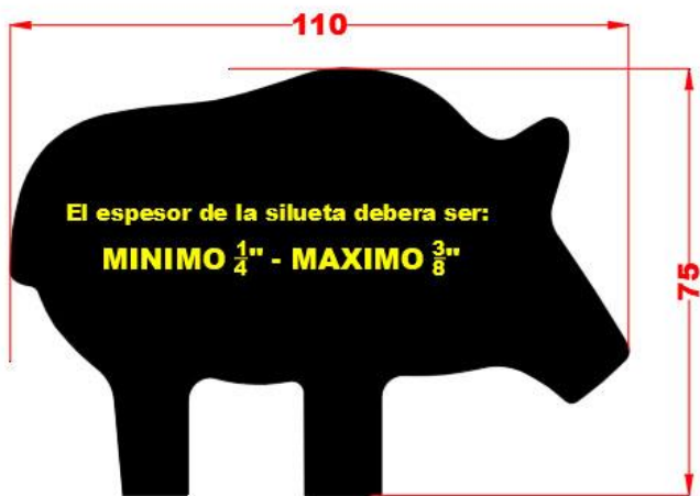
60 - Jabalí