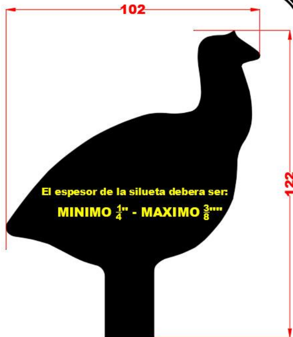
77 - Guajolote

Cualquier club afiliado a FEMETI, podrá descargar estas medidas, las cuales estan en formatos .jpg, .pdf y .dxf (este tipo de archivo lo lee cualquier maquina de corte).